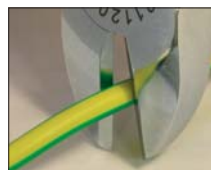
Do kabli izolowanych

OC ..... odległość cięcia, Oj* ..... Oj – jednostka opakowania PE – jednostka cenowa