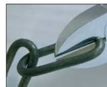
Do drutów oraz ogniów łańcucha