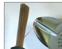
Do kabli wielozwojowych