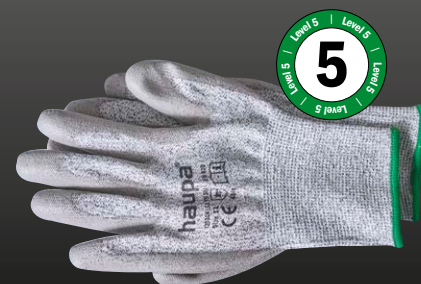
ściągacz zielony → poziom ochrony przed przecięciem 5