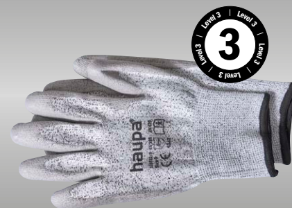
ściągacz czarny → poziom ochrony przed przecięciem 3